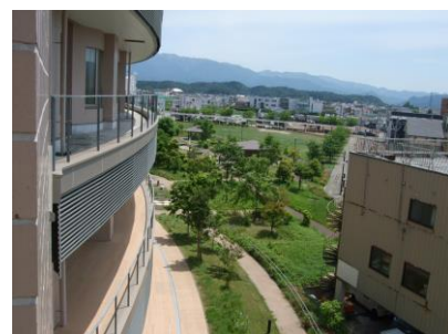
3年生教室からの風景